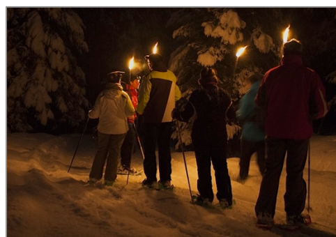
Sensations NEIGE & NUIT

1/2J, Journée, WE, Séjour... N'hésitez-pas à nous contacter.